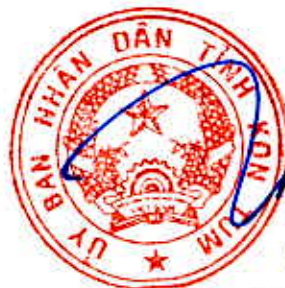
Lại Xuân Lâm